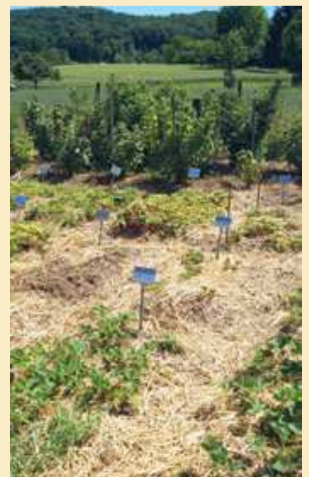
Die Einführungssammlung «Beeren» in Riehen (BS).

Jedes Jahr beschreibt ProSpecieRara im Rahmen des NAP-PGREL etwa 100 Pflanzen aus der Einführungssammlung in Riehen. Nicht immer ist es möglich, die Beschreibungen wie geplant durchzu-