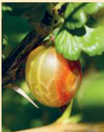
Stachelbeere mit Verbrennungen: Eine Beschreibung dieser Beere ist dadurch nicht möglich.

Wie geht es weiter, wenn die Beeren beschrieben und im Idealfall einer Sorte zugeordnet worden sind? Johannisbeeren und Stachelbeeren werden in verschiedenen Primär- und Duplikatsammlungen in der Schweiz abgesichert. Bei Himbeeren und Erdbeeren wäre der Erhaltungsaufwand auf dem Feld zu gross. Bei den Erdbeeren müssten jedes Jahr neue Ausläufer gepflanzt werden. Die Himbeeren scheinen sich in ihren Eigenschaften schnell zu verändern, so dass jede Rute immer überprüft werden müsste. Deshalb erhält die Arbeitsgruppe Beeren Erd- und Himbeeren für den NAP-PGREL nicht auf dem Feld, sondern in vitro im Labor von Agroscope. Vor der Erhaltung testen die Wissenschaftler die Pflanzen auf Quarantäneorganismen und befreien sie gegebenenfalls von solchen. Eine grosse Herausforderung bei der in vitro Erhaltung