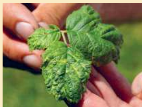
Der Schaden dieser kranken Himbeerblätter kommt wahrscheinlich von einem Milbenbefall.

Ob und wann die Beeren wieder in den Handel kommen, ist nicht klar. Gerade bei den Erdbeeren konnte in den letzten Jahrzehnten der Ertrag durch Neuzüchtungen beträchtlich gesteigert werden. Hinzu kommt, dass Konsumenten oft eine genaue Vorstellung davon haben, welche Farbe eine reife Erdbeere haben soll. Nicht wenige alte Sorten fallen aus diesem Schema, so dass sie kaum gekauft würden. Allerdings finden sich unter den alten Sorten viele mit geschmacklich sehr guten, charakteristischen Eigenschaften. Diese sind einerseits für Hobbygärtner attraktiv, andererseits könnten sie auch als Ausgangsmaterial für Züchtungen dienen. Bei Stachel- und Johannisbeeren